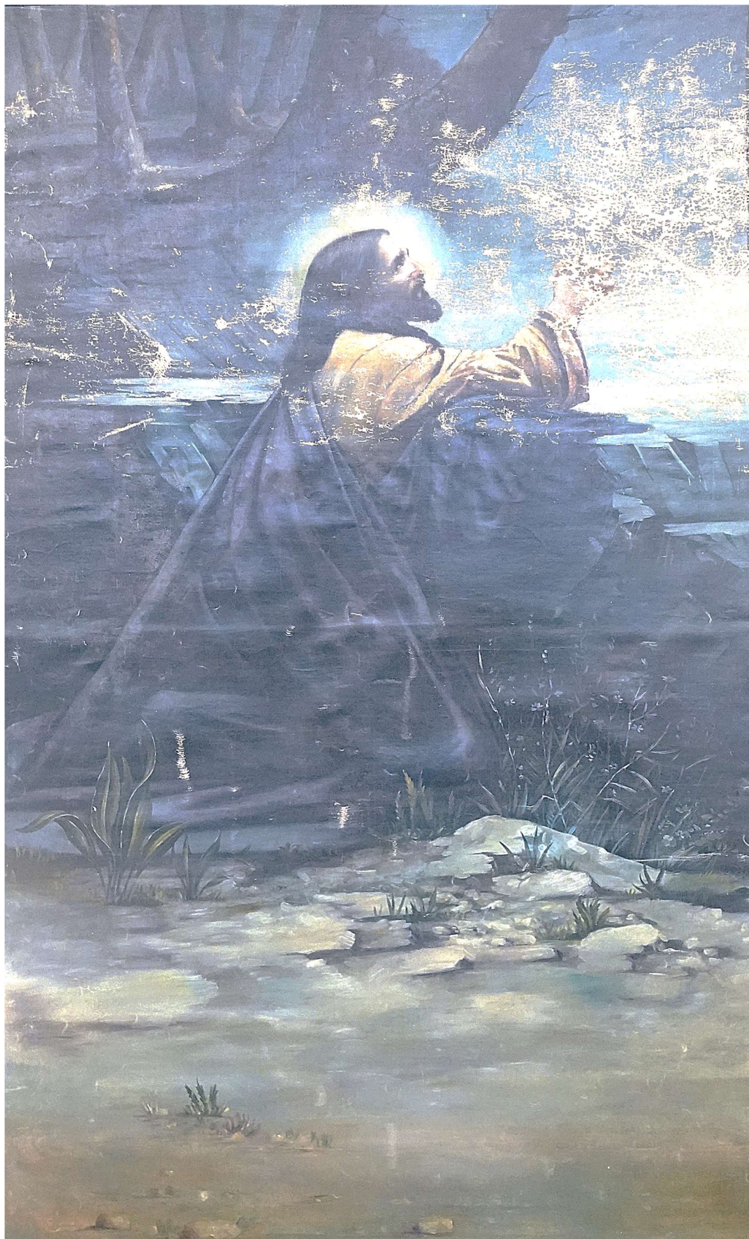
Postní plátno kostela sv. Václava v Tovačově