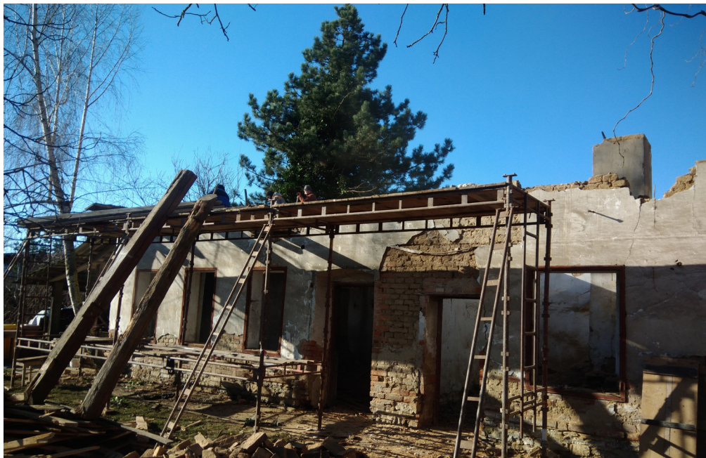
Demolice přístavku na faře – Brodek

Zásadní zprávou roku 2020 je udržení kostelních sbírek na solidní úrovni navzdory pandemii. Jak známo, šíření koronaviru nám přineslo úplný zákaz veřejných bohoslužeb v délce 9 týdnů a na dalších 11 týdnů včetně Vánoc drasticky omezilo počet účastníků na mši svatě. Za těchto okolností – které