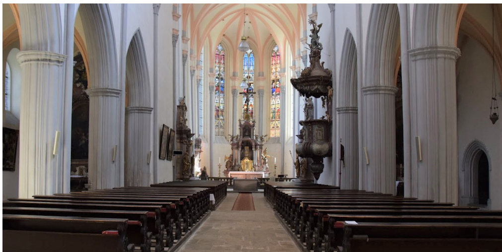
Kostel Narození Panny Marie v Roudnici nad Labem