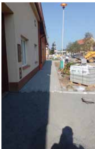
Ul. B. Němcově