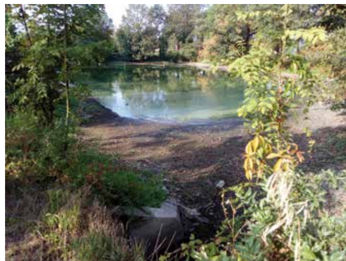
Vodní nádrže na Tovární – velké sucho a tropické teploty